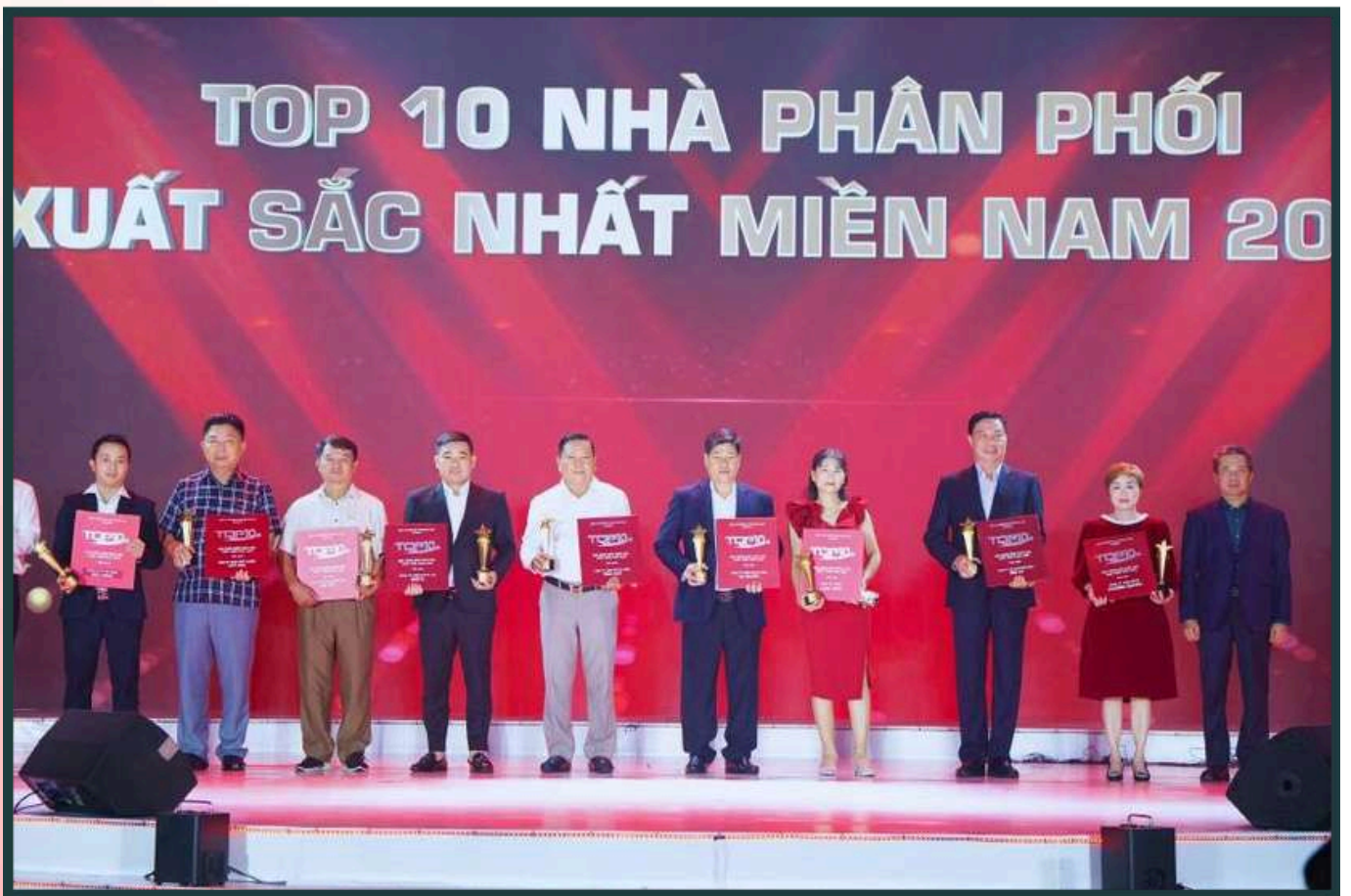
Top 10 nhà phân phối xuất sắc nhất Miền Nam 2023 Top 10 Outstanding Distributors in Southern Vietnam 2023